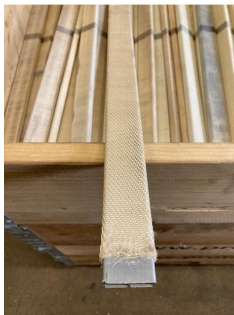
Korta space = Längd 710 mm