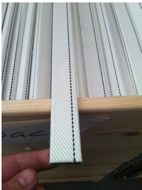
Långa space = Längd 780 mm

Alla långa space har en svart tråd och korta space är helvita, se bilder nedan: